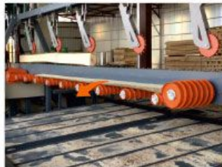
Cover dropping rollers Kapak düşürme ruloları