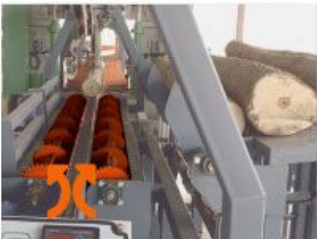
Log right-left turning Tomruk sağ-sol döndürme dişlileri