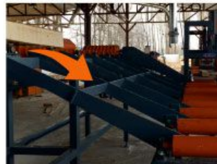
Board transfer to conveyor Kapak aktarım ünitesi

* Log loading station Tomruk yükleme *(Optional/ Opsiyonel)