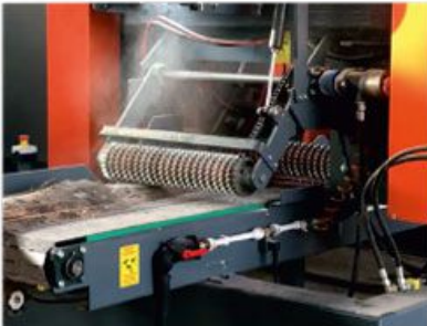
Heavy hold-down rollers Ağır üst baskı ruloları