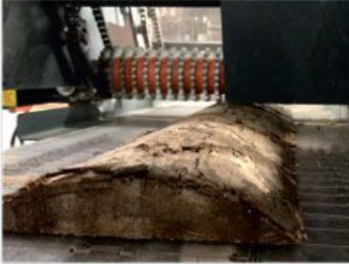
Stainless steel slat-chain Özel paslanmaz düz çelik zincir